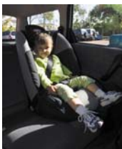
Подупируће седиште (са појасом преко крила или сигурносним појасом за дете) 14 до 26кг – од око 3 до 8 година