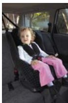
Седиште за мало дете (8 до 18кг)